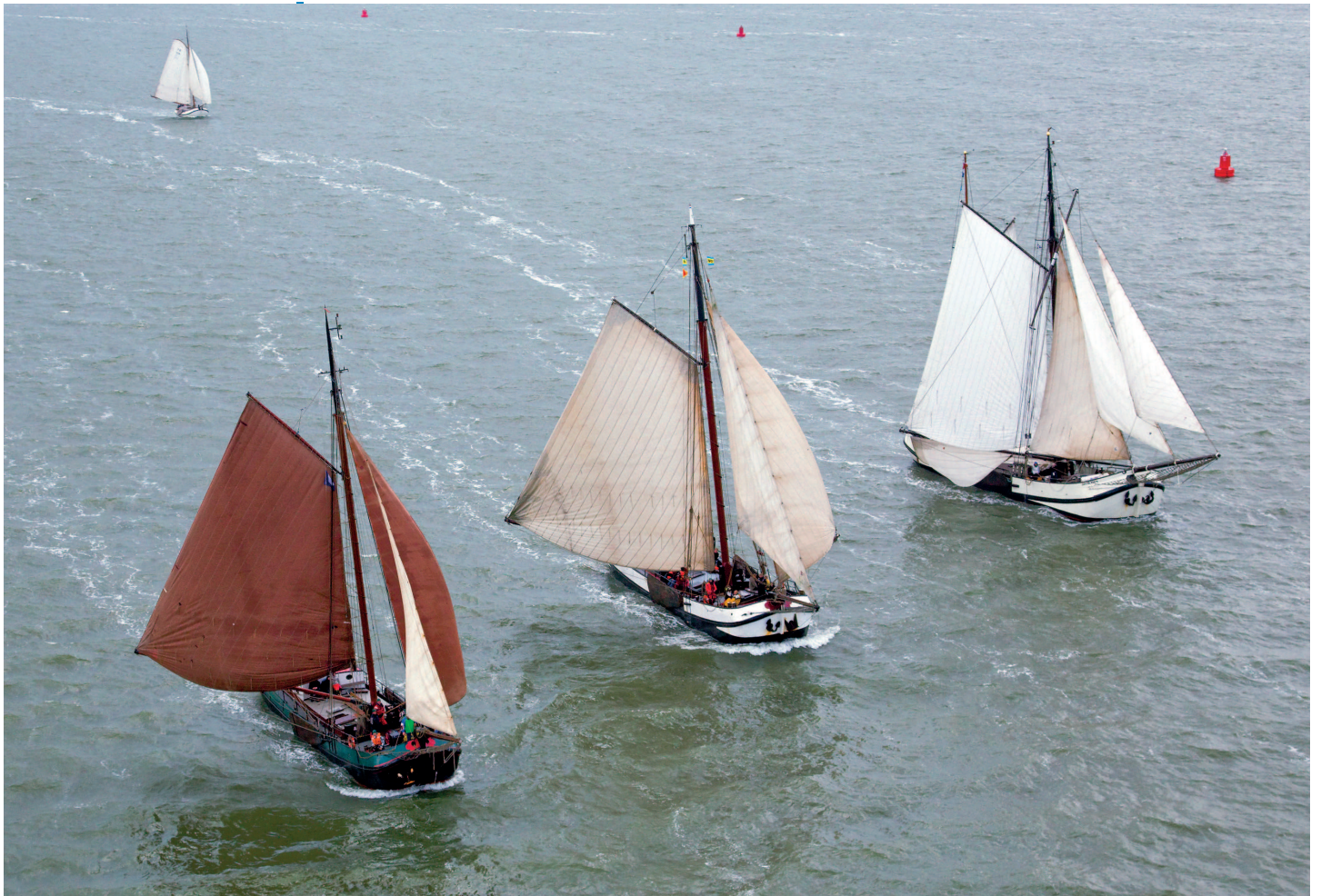
Zleva: Tjalk MAURICIUS, Tjalk LARUS a koftjalk JAN HUYGEN

zde vykázány do vod západního Wattového moře, kde je moře hlubší a pro jejich kýly příznivější. „Jaká loď je nevhodnější pro plavbu Wattovým mořem?“ Odpověď je ve skutečnosti velmi jednoduchá. Každá loď, které jste schopni zabezpečit dostatek vody pod kýlem. Nicméně její ponor určuje oblast vašeho pohybu a tvar kýlu omezuje vaše možnosti, jak přistát na písčité mělčině v době odlivu.