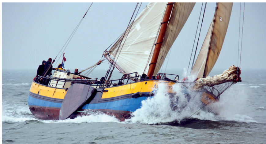
Hasselter AAK MAXIMA pod vedením skippera Olafa Stiga