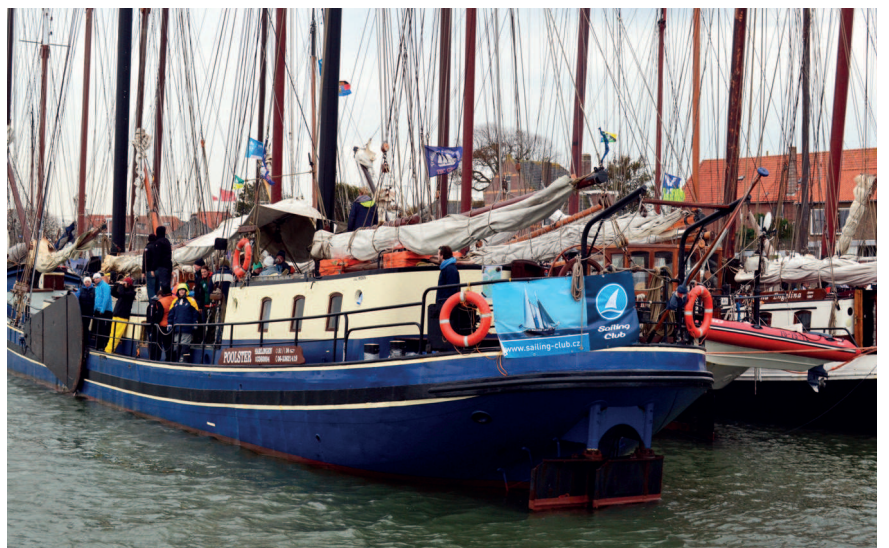
Klipr POOLSTER se skipperem Joskou

ské domky, přístavy, muzea, památníky a rybářské lodě naleznete všude na pobřeží Wattového moře. Harlingen je domovem pro cca 80 historických plachetnic již dlouhá léta. Klipry, tjalky, skutsje, lemsteraaky, aaky a další lodě z minulého a předminulého století. Všechny patří mezi lodě s plochým nebo kulatým dnem, které postrádají tradiční kýl. Po stranách však mají „zwaarden“ (dřevěné kýly).