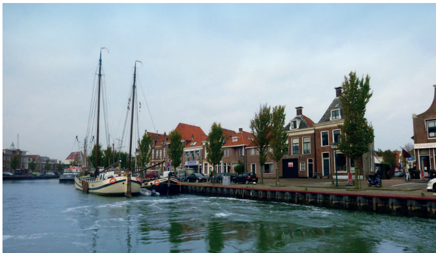
Jižní přístav – Harlingen

žádná světla. Jen tmu a světla starých pomocníků – holandských majáků. Hvězdy jsou tu člověku blíže, jen se jich dotknout.