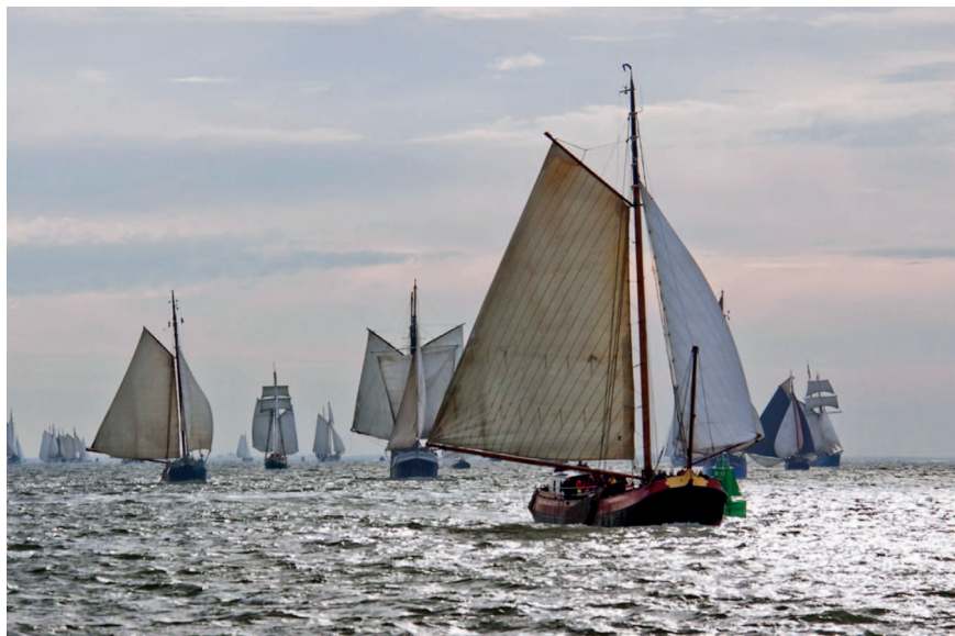
Tjalk ALBATROS z Makkumu

Na ostrově jsou kouzelné stezky pro pohodlná holandská kola, vlídné hospůdky, kde voní čer-stvé ryby a restaurace „brusinkový ráj“ s bru-sinkovými dobrotami všeho druhu. Kytara zní ještě dlouho do noci, ze všech se už stali ná-