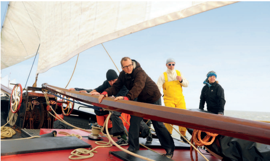
Práce s ráhny a plachtami na palubě klipru FRANS HOROUS