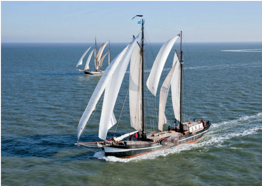
Dvoustěžňový klipr PASSAT

mořníci, alespoň soudě podle zasvěceného hovoru o směru a síle větru. Ráno je mlha, vypadá to, že z moře se stal přes noc rybník. Vrcholí příliv a to je nejvyšší čas opustit ostrov a zamávat majáku Brandaris. Za přístavním molem nám počasí ukazuje svižný obrat – fouká velmi svěží bočák a dělají se velké vlny. Balíme se do bund a na přídi dostáváme první sprchu slanou vodou. Do přístavu v Harlingenu vplouváme pod plachtami, jdou dolů až v prvním bazénu. Profesionálové předvedli kousek námořnického umění pro suchozemce, co jsou mokří, slaní a ve skrytu duše se ale cítí být taky mořskými vlky.“