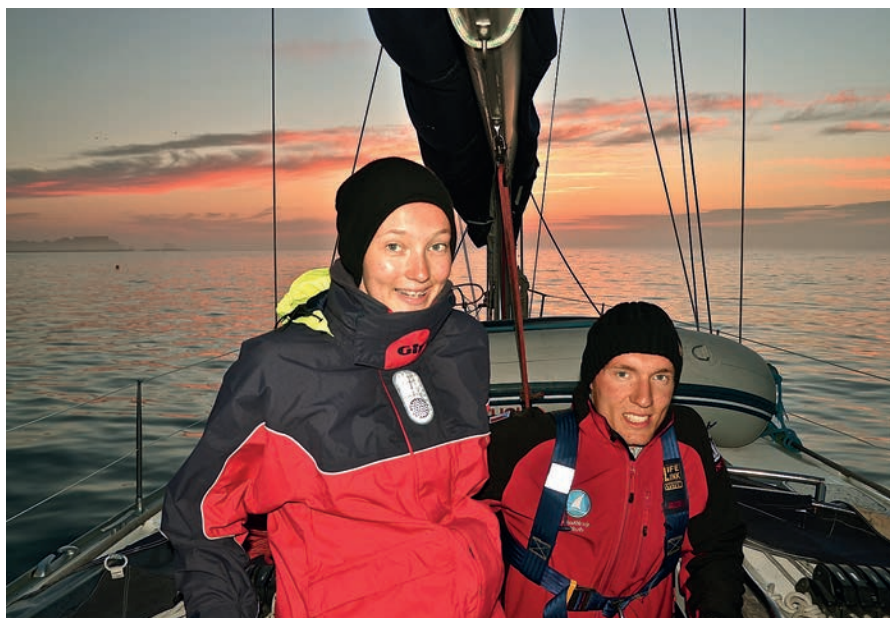
Přes La Manche

viště k molům, lezli skoro jako po žebříku, takový měla lávka sklon směrem dolů a za pár hodin se lávka téměř srovnala s pevninou do roviny. Škoda, že to už byly všechny zásoby a zavazadla na lodi.